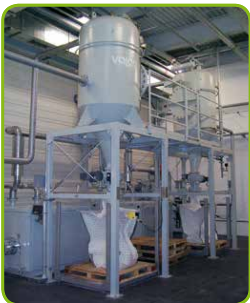
Zentrale Staubsauganlage in der Automobilindustrie, explosionsgeschützt, Volumenstrom 2000 m 3 /h bei 40 kPa Unterdruck.

Zentrale Hochvakuumanlagen mit Unterdrücken bis 0,7 bar, für Materialtransport und für industrielles Staubsaugen.