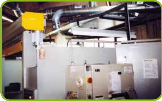
◀ Roboterabsaughauben in verschiedenen Ausführungen, z. B. mit Randabsaugung oder nur als Düsenplatte, speziell für den Kunden angepasst ▼