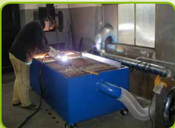
◀ Absaugtisch mit Wasserbad für Brennschneidarbeiten. In versch. Größen lieferbar.