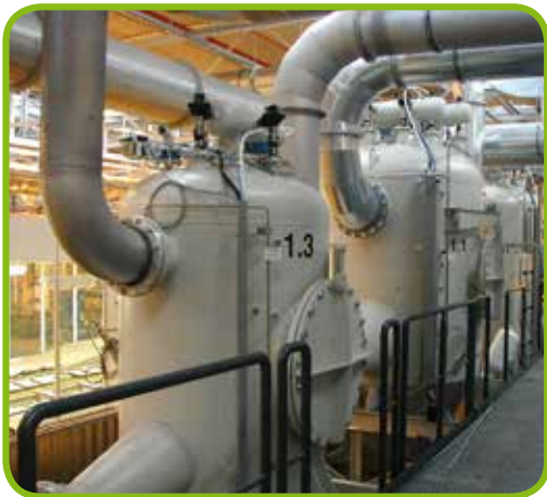
ATEX-Patronenfilter, 11 bar druckstoßfest für explosionsfähiges Pulver

Eingesetzt für die meisten vorkommenden Staubarten in der Industrie. Die Filter werden in Standardausführung mit einer Filterfläche von 10 - 3600 m 2 geliefert. Wählen Sie zwischen Schlauchfiltern für komplizierte Entstaubungsaufgaben oder Patronenfiltern für trockene und rießelfähige Staubarten.