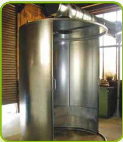
◀ Drehbare Absaughaube für Brennschneidarbeiten speziell für den Kunden angepasst ▼