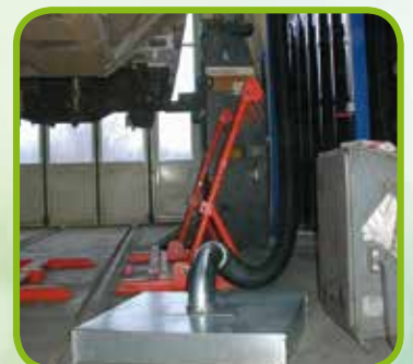
► Schlauchaufroller mit Absaughaube