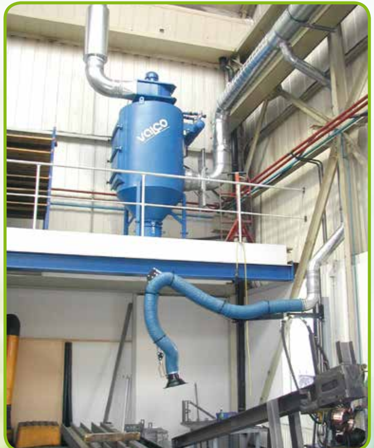
▼ Kompaktfilteranlage Typ RX-7500 für Schweißrauchabsaugung über Absaugarme.