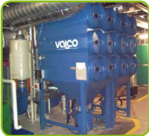
Patronenfilter mit 60 m 2 Filterfläche (PTFE-Membrane) und 60 m 2 Sicherheitsnachfilter, Filteranlage innerhalb für ATEX Zone 20