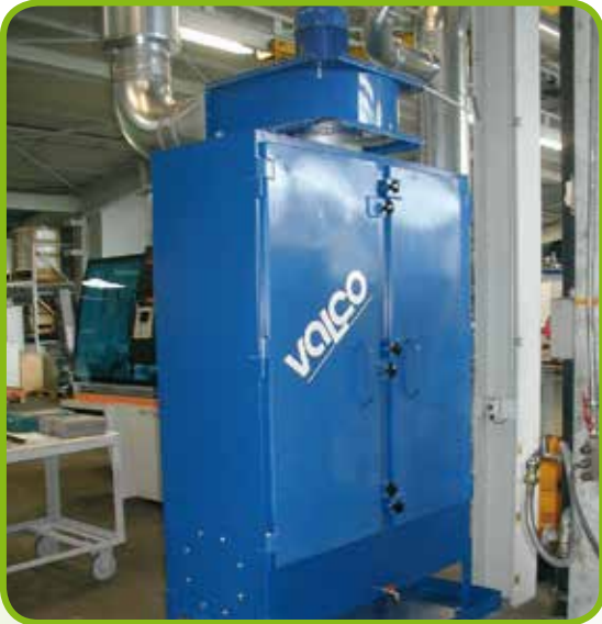
▼ Entstaubungsanlage mit Schlauchfilter für 40.000 m 3 /h, Stahlguss-Gießerei.